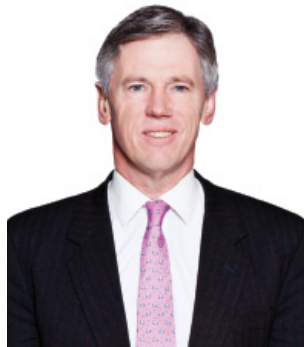
The Hon. Philip Remnant CBE ACA 高級獨立董事