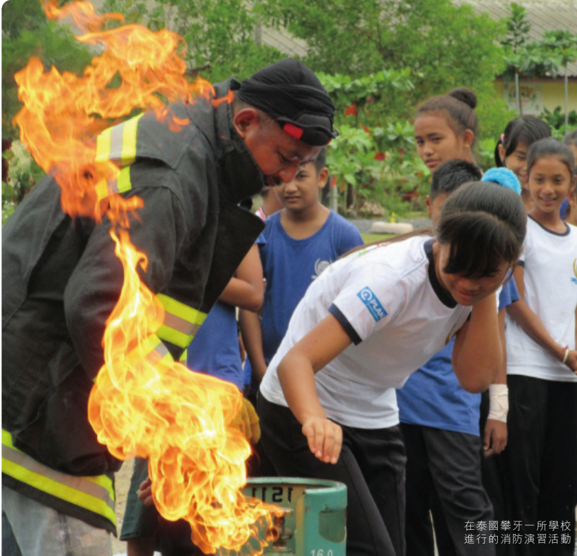
在泰國攀牙一所學校進行的消防演習活動